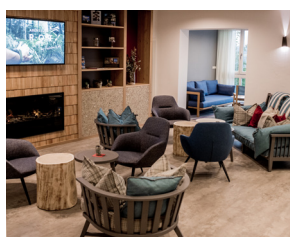
Lodge & Therme Bad Griesbach

Die Kosten für RV Fit trägt die Deutsche Rentenversicherung. Fahrtkosten werden Ihnen erstattet. Sie erhalten pro Termin pauschal fünf Euro Fahrtkosten für die Termine, an denen Sie tageweise teilnehmen. Für die Phasen mit Übernachtung werden für die An- und Abreise mit der DB (2. Klasse) oder dem PKW (20 ct/km) erstattet, sofern die Kosten tatsächlich angefallen sind.